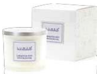
Candela Lavanda 150 ml

Oli essenziali puri: per le candele usiamo solo Oli Essenziali miscelati in cere vegetali e stoppini in cotone. Per gli Spray e Diffusori Ambiente, gli Oli essenziali sono infusi in alcool di derivazione vegetale. U.V. = Pz.