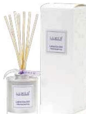
Diff. Bastoncini 100 ml