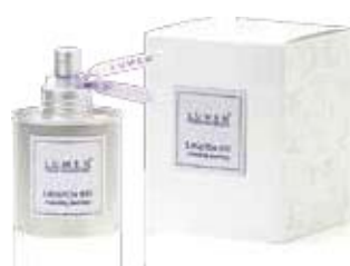
Spray Lavanda 100 ml